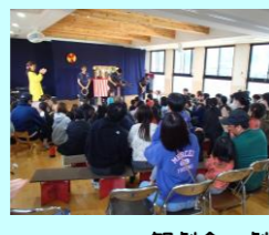
観劇会 劇団「風の子九州」