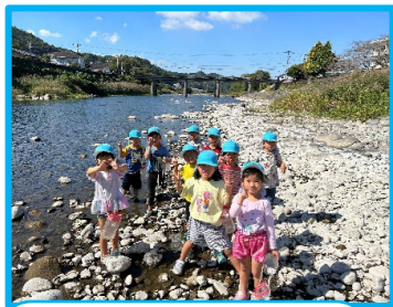
ちゅうりっぷ組 メダカはどこだ?