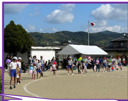
さくら組 大根の種をまいたよ!