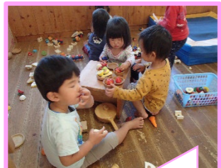
もも組 ままごとあそび 楽しいよ!