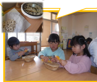
たんぼぼ組 ポップコーン できたー!