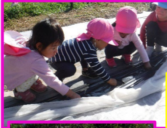
うめ組 そらまめ植えたよ!